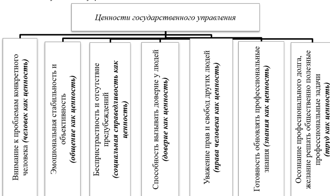
Рис. 1. Ценности государственного управления

О.В. Фролов выделяет следующие ценности государственного управления [14, С.139], влияющие на профессиональное поведение государственных служащих (Рис.1).