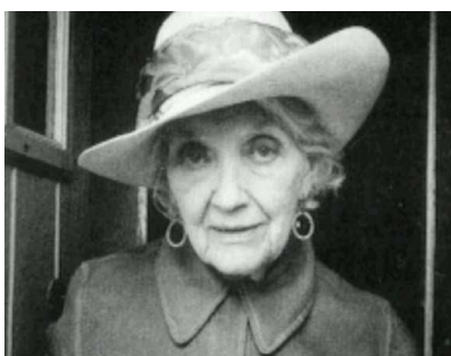
Рис Джин (Jean Rhys), имя при рождении – Элла Гвендолин Рис Уильямс (Ella Gwendolen Rees Williams); 21