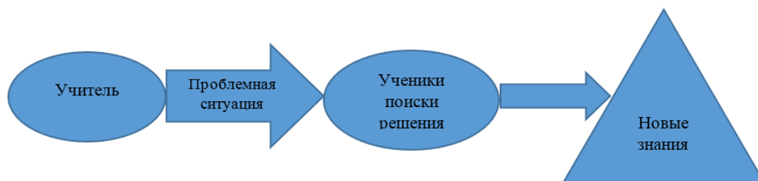
Рис. 1. Технология проблемного обучения

Технология проблемного обучения (см. рис. 1)