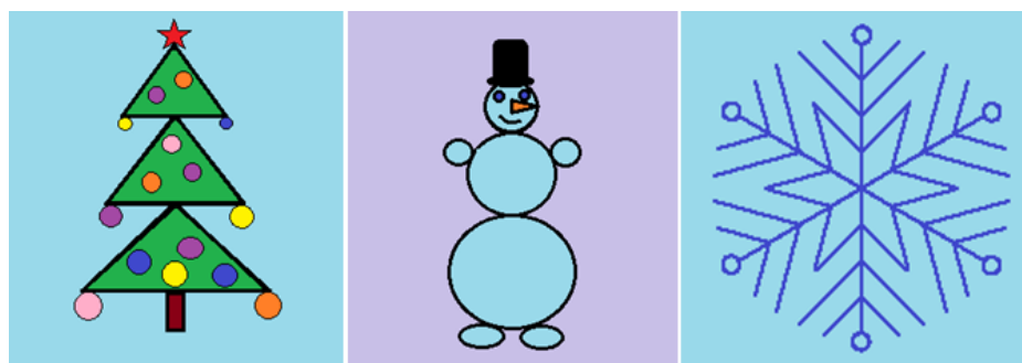
Рис. 1. Эскизы, выполненные в редакторе Paint

Проведённый опрос перед практической работой выявил осведомлённость большей части класса о программе. Для успешного получения запланированного результата Кристиной Юрьевной разработаны технологические карты (см. таблицу 1).