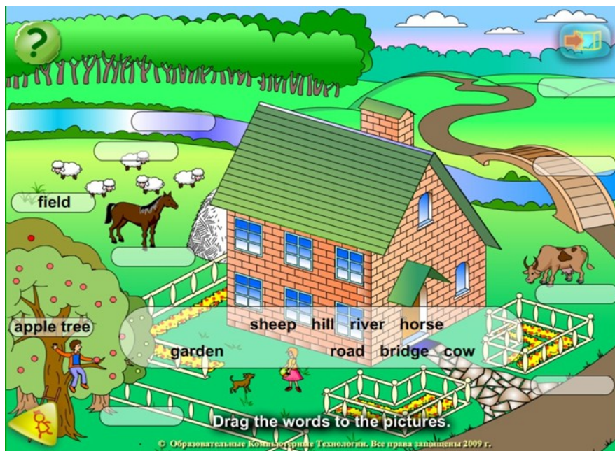
Рис.2. Пример лексического упражнения (программа “Enjoy Listening and Playing”). Первый этап

частей. В первой части обучающимся предлагается прослушать и повторить слова, которые относят к разделу 3 “We like the place we live”. После прослушивания все слова спускаются вниз, а обучающиеся при помощи компьютерной мыши должны соотнести слово с картинкой.