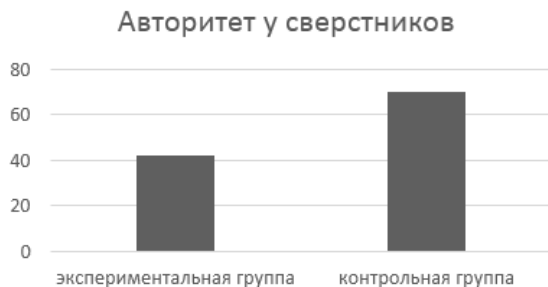
Рис.2. Самооценка: авторитет у сверстников

(подростки с РАС имеют более низкие оценки по этой шкале), а также по шкале «Уровень притязаний: характер» (здесь притязания экспериментальной группы оказались более высокими, чем у контрольной группы). Различия представлены на рисунках 2 и 3.