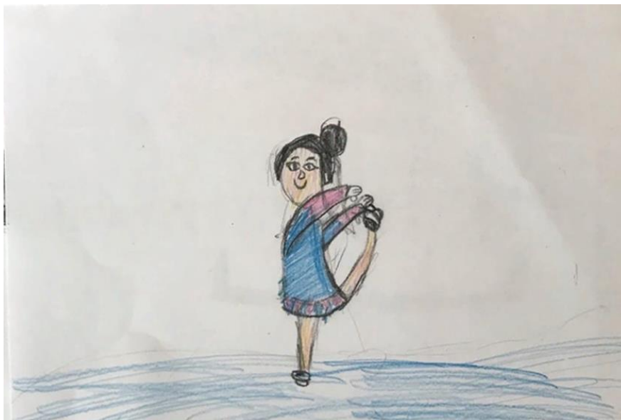
Рис.2. Рисунок дошкольника на тему «Самый любимый Олимпийский вид спорта»

Следующим этапом было проведение квест-игры. Для этого было выбрано помещение группы детского сада. В нем мы разместили разные этапы квест-игры в разных комнатах группы, в которых были волонтеры. Волонтер предоставлял детям задание на каждом этапе. Все игровые задания созданы в соответствии правилам безопасности для жизни и здоровья воспитанников. В содержание сценария мы внесли разные виды деятельности, такие как познавательная деятельность (разгадывание ребусов, викторина), двигательная деятельность (показать движениями спорт), речевая деятельность, умственная деятельность (игра «Олимпийское Лото»). На каждом этапе последовательно за выполненное задание дети получают букву, в конце всех этапов, нужно составить слово. Волонтер определяет время на каждом этапе квест-игры в течении 10 минут.