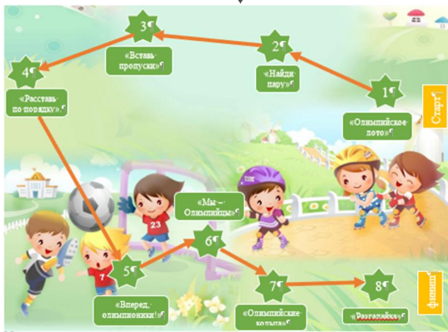
Рис.3. Маршрутный лист к квест-игре «Олимпийские значки»

На заключительном этапе квест-игры дети составили слово из букв, которые им давали за выполненные задания. Полученное слово «Чемпион» привело их к плакату «Олимпийские чемпионы г. Кирова». С помощью данного плаката дети получили возможность познакомиться с Олимпийскими чемпионами г. Кирова, узнать ФИО, вид спорта, которым занимался данный спортсмен, дату Олимпийских игр с его местом на пьедестале.