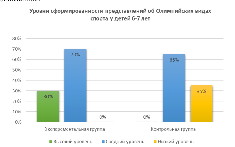
Рис. 4. Уровни сформированности у детей 6-7 лет представлений об Олимпийских видах спорта на контрольном этапе

Таким образом, можно сделать вывод, что использование квест-игры эффективно влияет на процесс формирования представлений об Олимпийских видах спорта у детей 6-7 лет. Дети узнали больше об Олимпийской истории, Олимпийских чемпионах, символах Олимпийских игр, а также об Олимпийских видах спорта.