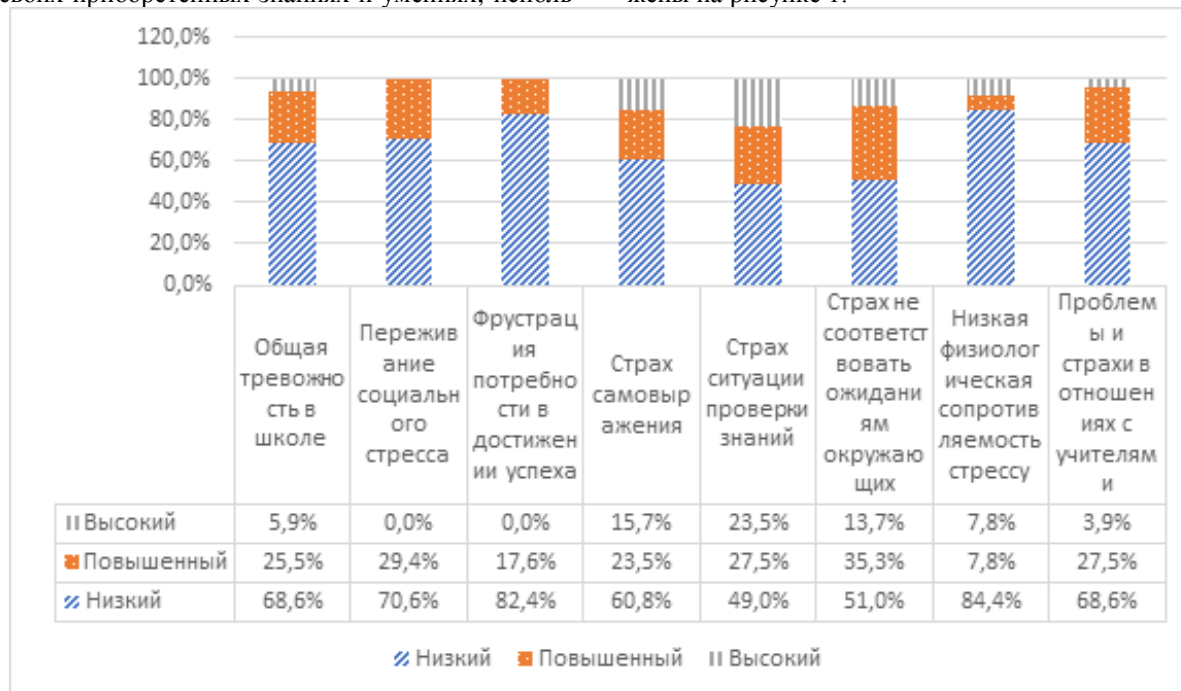
Рис. 1. Результаты исследования тревожности

Результаты исследования тревожности отражены на рисунке 1.