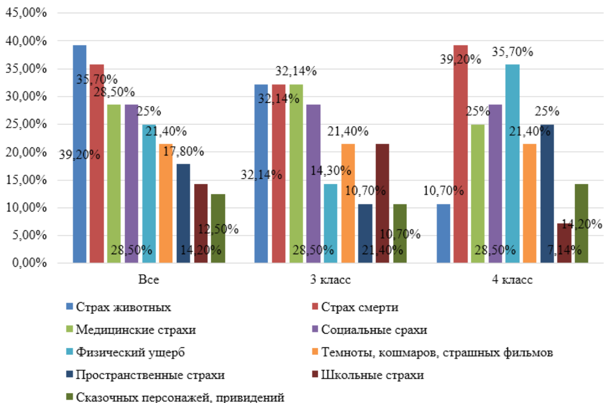
Рис. 1. Объекты чувства страха у обучающихся третьих и четвертых классов по методике «Страхи», %

Мы сравнили объекты чувства страха респондентов из третьих и четвертых классов по методике «Страхи» авт. А.И. Захарова, отраженные на рисунке 1.